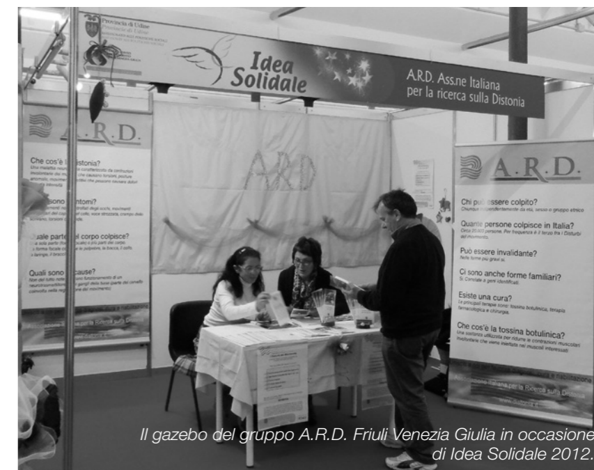
Il gazebo del gruppo A.R.D. Friuli Venezia Giulia in occasione di Idea Solidale 2012.

Nell'ambito dell'edizione di "Idea Natale", organizzata da Udine e Gorizia Fiere dal 15 al 18 Novembre 2012, ha trovato posto come da tradizione "Idea Solidale", manifestazione promossa dall'Assessorato alle Politiche Sociali della Provincia di Udine in collaborazione con il Centro Servizi per il Volontariato, dedicata alle numerose realtà no profit del nostro territorio. Un'importante occasione per il mondo del Vo-